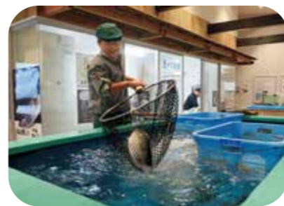
大きな生け簀で泳ぐ地魚はその場で調理してくれる。活きのいい魚を味わうチャンス