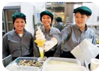
「レッドパール」という品種のイチゴソフトクリーム 350円。さっぱりとして男性にも人気

☎0599・21・1080 / 10:00~18:00 (地産ビュッフェレストランは 11:00~13:30LO、大人1480円) / 水曜・12月31日~1月3日休 / 鳥羽市鳥羽 1-2383-42 / 近鉄・JR鳥羽駅から徒歩2分 http://tobamarche.jp/