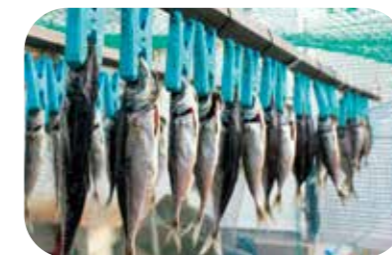
洗濯ばさみに挟まれて揺れる菅島のアジ