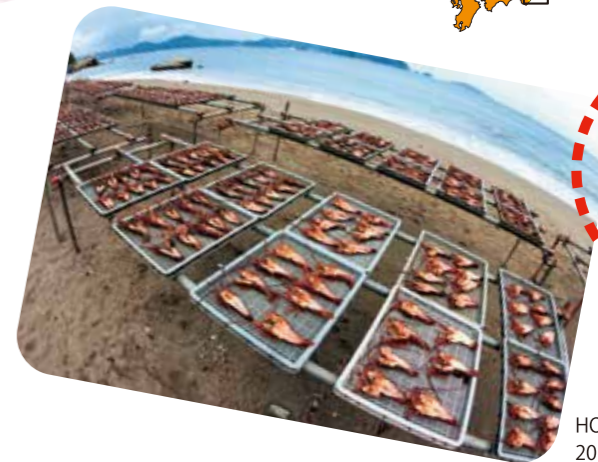
HOSU プロジェクト2013では「伊勢えび千匹干し」の壮大な光景が見られた