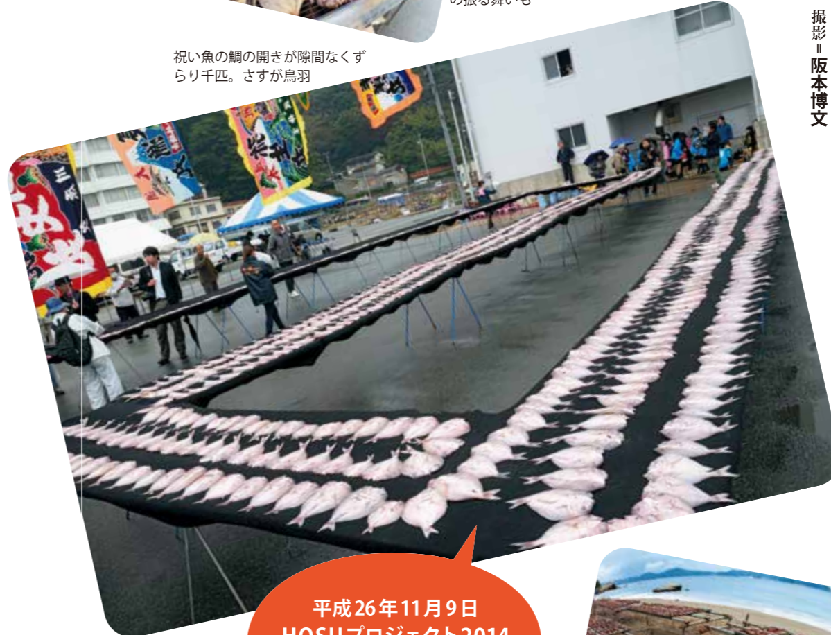
祝い魚の鯛の開きが隙間なくずらり千匹。さすが鳥羽