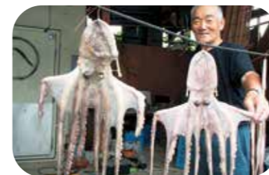
答志島の干しタコ。タコ飯にして味わうのが一番美味だとか

伊勢神宮に奉納する「熨斗鮓」※に起源を持つ「HOSU(干す)」文化があちこちにある鳥羽。海辺を歩けば、小魚やタコたちが澄ました顔で洗濯物と一緒に揺れ、港ではヒジキやアラムの海藻軍団が、我が物顔でお日様を浴びている。この地にかかれれば「祝い魚」で知られる伊勢エビ、鯛、アワビなど高級食材も「HOSU」。鳥羽でどんな「HOSU」に出会えるか、楽しみにしながら訪れたい。